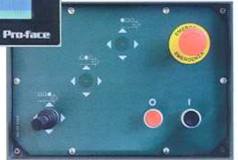
REPEAT SETTING JOYSTICK