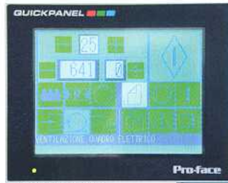
FLAT TOUCH SCREEN 6"